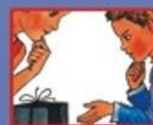
В МАГАЗИНЕ- ПРОДАВЦУ