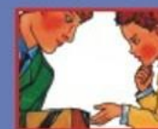
В ТРАНСПОРТЕ- ВОДИТЕЛЮ