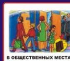
В ОБЩЕСТВЕННЫХ МЕСТАХ