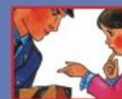
НА УЛИЦЕ ИЛИ В МЕТРО- ПОЛИЦЕЙСКОМУ