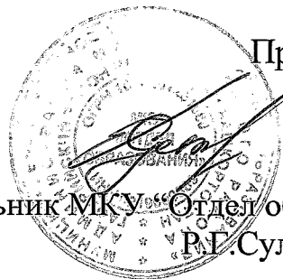
ГРАФИК проведения школьного этапа всероссийской олимпиады школьников на 2020-2021 учебный год.